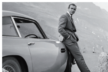
ショーン・コネリー 『007』