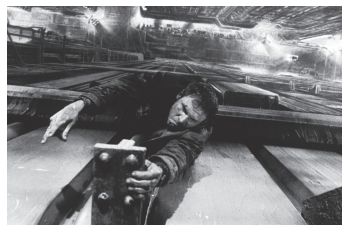
ハリソン・フォード 『ブレードランナー』