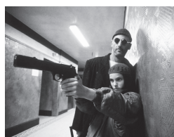
ジャン・レノ 『レオン』