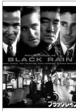
ブラックレイン (1989年アメリカ映画)

トム・クルーズが主演のスパイ映画。アクションだけでなくコメディぽく 作ってあるのでとてもおもしろいです。最後はハッピーエンドでラテン風 の音楽が流れるので気持ち良いですよ。