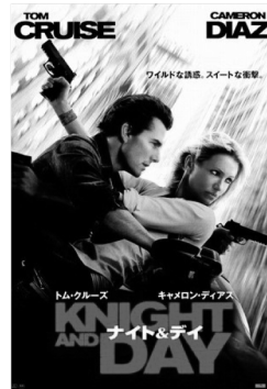
ナイト & デイ (2010年アメリカ映画)